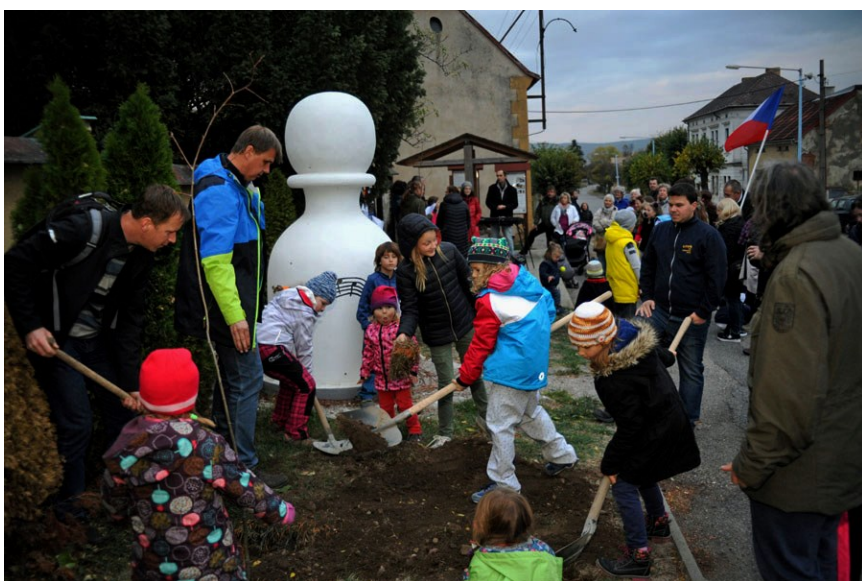
Lípy republiky pomáhali v Litni vysadit ti nejmladší.

Ve čtvrtek 25. října se nás sešlo asi padesát, obyvatel Litně, Bělče, Leče a Vlenců, na slavnostním vysazení nových lip republiky.