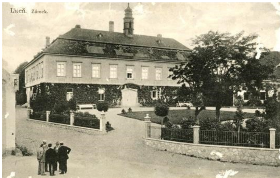
Zámek Liteň na historické fotografii.

Jelikož Rakousko-Uhersko bylo ze všech stran obklopeno nepřátelskými státy, byl prakticky znemožněn jakýkoliv dovoz a vývoz zboží. Brzy se tak objevil obrovský nedostatek potravin, uhlí, kovů a jiných základních potřeb. Bezprostředně po vypuknutí války byl proto zaveden přidělový systém a 21. 11. 1914 byly poprvé provedeny rozsáhlé soupisy potravin u rolníků. A poté 28. 2. 1915 u všech občanů. Následně 9. 5. 1915 byl proveden soupis všech barevných kovů v domácnostech, jako byl cín, mosaz, měď, bronz. Jednalo se především o svícný, vany, postele, váhy, závaží atd. Se zhoršující se situací Rakouska-Uherska se začaly soupisy rozšiřovat, a to na osivo, brambory, dříví, uhlí, cukr, sůl, seno, slámu atd.