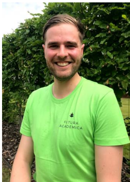
Simon Flemr.