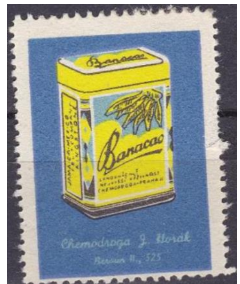
Nálepka Banacao, která se lepila do soutěžního katalogu.

13 037 obyvateli sídlem okresního soudu, nemocnice, má několik středních škol, státní reálné gymnázium, obchodní akademii, obchodní školu, družstevní, textilní, hospodářskou a zahradnickou školu. Ze starobylých památek zachoval se zde gotický chrám sv. Jakuba z XVI. století, radnice z roku 1302, dvě historické brány aj. Na náměstí se uchovaly starobylé domy a kolem vnitřního města zbytky opevnění. Z průmyslu převládají velké cementárny a vápenice, továrna asbestu a břídlíce, továrna hospodářských strojů, pekařských strojů, tkalcovna, pivovar, cukrovar atd. Ve městě je také výroba známého dětského banánového kakaového značky Banacao.