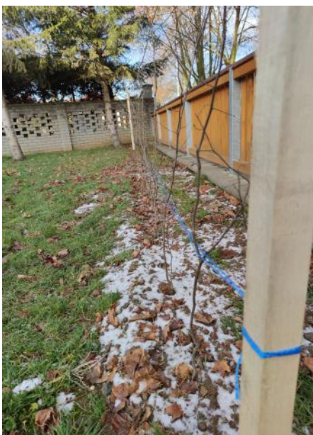
Nový habrový plot.